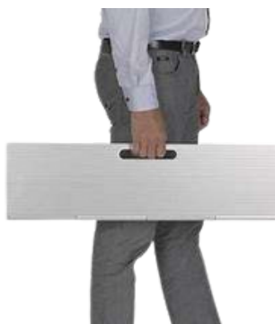
Rampa portátil salvaescalones